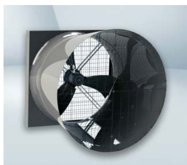
Ventilador eletrônico para aviários.

Os benefícios para os aviários, as aves e aos produtores em utilizar o ventilador eletrônico EC ebmpapst são: