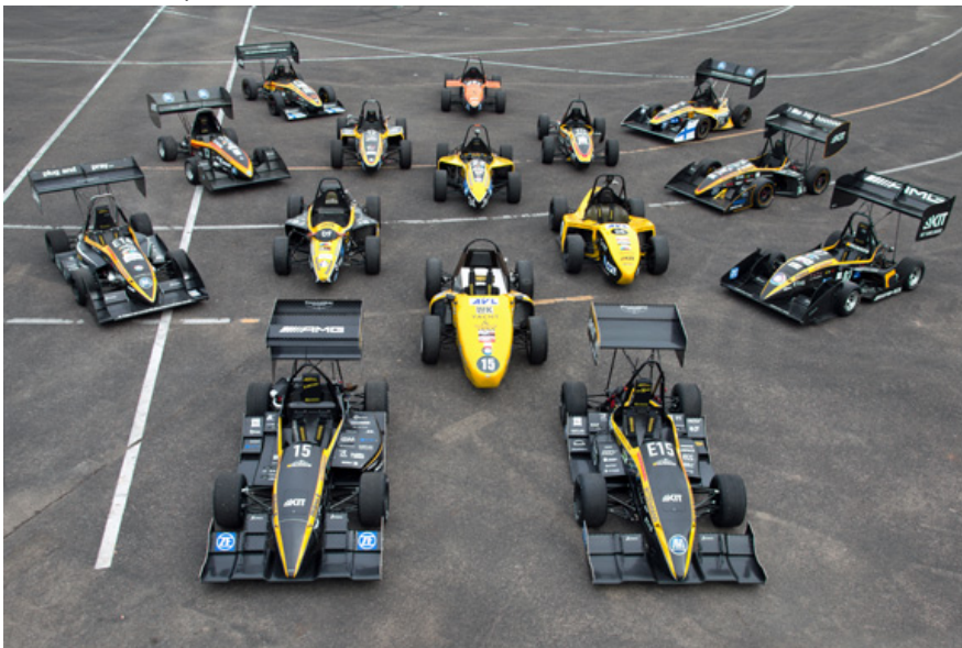
Fig. 1: Os carros "KIT" dos últimos dez anos.

Tel.: +55 11 4613-8707 marketing@br.ebmpapst.com www.ebmpapst.com.br facebook.com/ebmpapstBrasil twitter.com/ebmpapstBrasil linkedin.com/ebmpapstBrasil